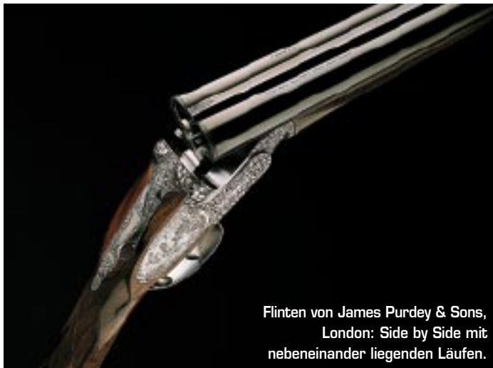
Flinten von James Purdey & Sons, London: Side by Side mit nebeneinander liegenden Läufen.