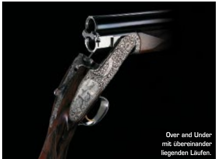
Over and Under mit übereinander liegenden Läufen.