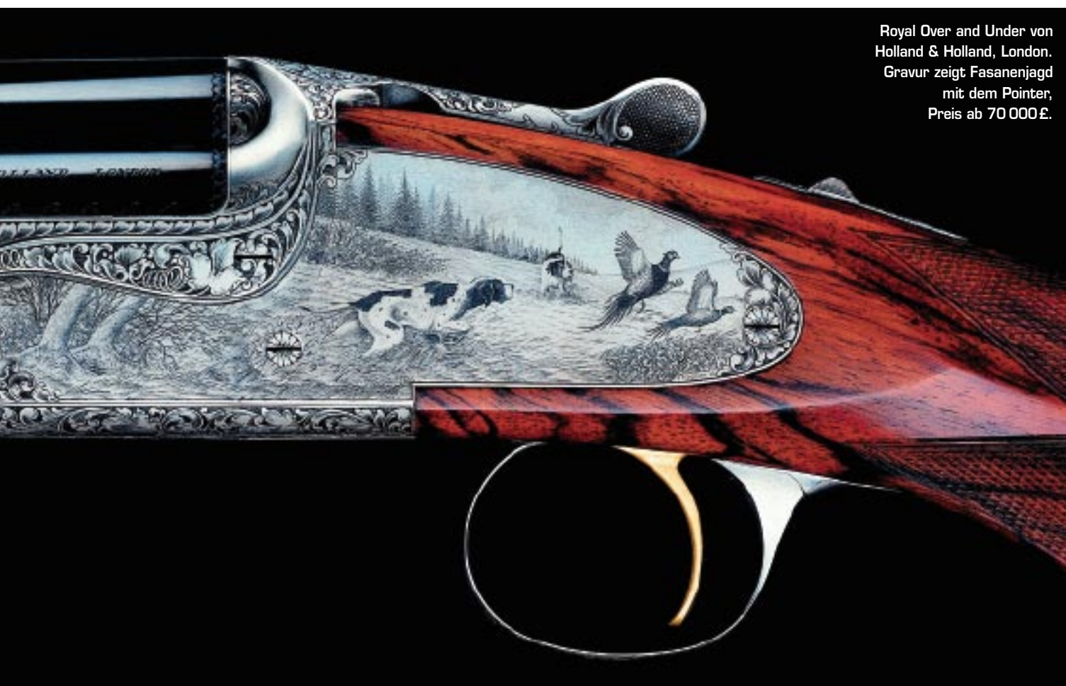
Royal Over and Under von Holland & Holland, London. Gravur zeigt Fasanenjagd mit dem Pointer, Preis ab 70 000 £.